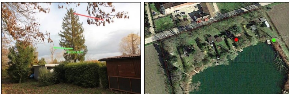
Abb.: 5 rot: Turmfalkebrutplatz, grün: Standort für Nisthilfe (Empfehlung Dipl.-Biol. A. Malten)

Darüber hinaus wird festgesetzt, dass im Geltungsbereich dauerhaft eine Nisthilfe für Turmfalke vorzuhalten ist, um bei Verlust derselben jeweils für Ersatz zu sorgen.