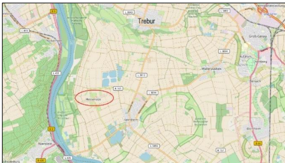
Abb.: 2 Lage im Raum (Hesse-naue = rotes Oval)