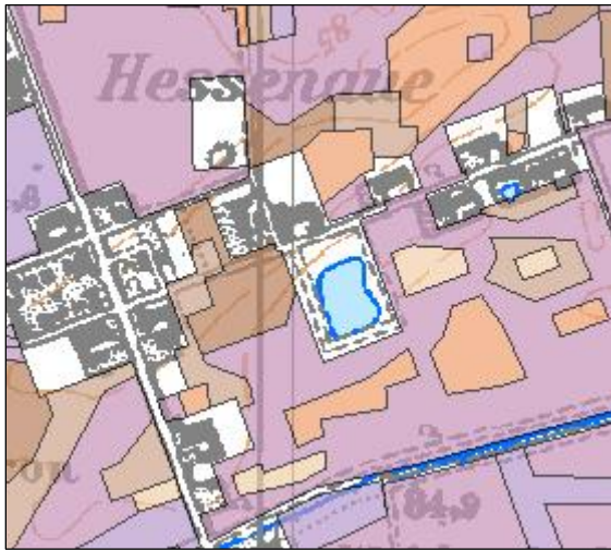
Abb.: 4 Bodenflächen

Im nordwestlichen Dreieck des Geltungsbereiches finden sich Böden aus carbonathaltigen tonigen Auensedimenten, die morphologisch Umlaufflächen älterer Mäandersysteme des Rheins darstellen. Sie werden der Bodeneinheit Humuspelosole mit Auendynamik, im Untergrund mit Gley-Vega zugeordnet, die hier aus 1 bis 6 dm Auenschluff oder -ton über 3 bis 10 dm Auenton, meist über 2 bis 10 dm Auenschluff mit Carbonatanreicherungshorizont/Rheinweiß, über Flusssand (Holozän) geschichtet ist. Die Bodenart wird wie folgt klassifiziert: Klasse 6, L (L, L/S, L/SI, L/Mo, LMo)