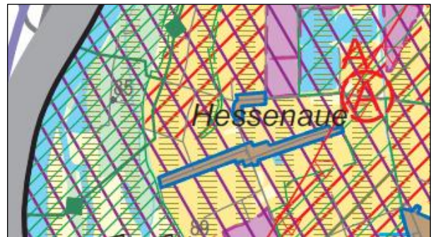
Abb.: 3 Ausschnitt Regionalplan Südhessen 2010

Hesse-naue gehört zum Unterzentrum Trebur und ist ein südwestlich des Kernortes gelegener Ortsteil. Bemerkenswert ist die Nähe zum Rhein und die Tatsache, dass der im Geltungsbereich befindliche See trotz seiner geringen Größe als Bestand im Regionalplan dargestellt ist. Im Unterschied zu weiten Flächen der Gemarkungen liegt unser Geltungsbereich nicht im Gebiet der Siedlungsbeschränkung für den Flughafen Frankfurt am Main.